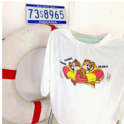
チップ&デール Tシャツ M、Lサイズ 2,900円