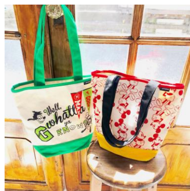
トートバッグ 各 2,900円