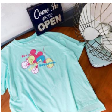
ミッキー Tシャツ M、Lサイズ 2,900円

夏らしいポップなカラーで音楽に合わせて踊るミッキーの後姿がかわいらしいアートのTシャツや、レインボーカラープリントのミッキーやガーフィーの息子であるマックスのアートなど、他にはなかなか無い、ポップでストリート感たっぷりのアートを集めてデザインしています。これから本格化する夏のレジャーや夏フェスなどのお出かけシーズンと一緒に、是非お楽しみください。