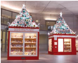
2016年の神戸・三宮展示会場風景

「世界の子どもたちに手づくりのぬいぐるみを贈ろう」を合言葉に、1997年にスタートしたプロジェクト。全国のお客さまに、おうちにある洋服や思い出の布などで手づくりしていただいたぬいぐるみ(ハッピートイズ)は、フェリシモがお預かりし、各地で展示をした後に世界各地の子どもたちに寄贈。これまでに誕生したぬいぐるみは57,000以上。国内外57の国と地域へと旅立っています。東日本大震災の被災地の子どもたちにも贈っています。