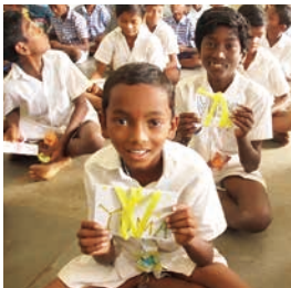
インドと日本の子どもたちがコットンの 絵やお手紙を交換しています。

お気に入りの洋服が、未来の地球の環境保全につながっている。サステナブルな循環型社会を、着る人、売る人、作る人がみんなで手をつないで実現していくプロジェクトです。2008年からスタートしたこのプロジェクトはまもなく10年目を迎えます。この節目にPBPをOPEN化することを目指して、2017年5月、一般財団法人PEACE BY PEACE COTTONを設立いたしました。PBPが永続的に発展しつづけるための仲間を増やすことをミッションに、世界中の繊維業界各社さまがプロジェクトに主体的に参加して下さることを目指し、参加するすべての人の笑顔や、豊かで健やかな大地へ恩返しができるような仕組みづくりに取り組んでいます。