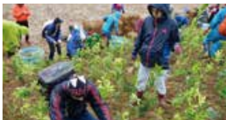
福島県南相馬市での植樹祭