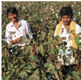
土地に合った種や土を研究しながら、 有機農法への転換が行なわれています。