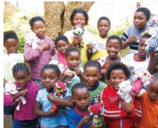
南アフリカ共和国での寄贈風景