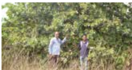
10年経過したカシューナッツの木

タゴール協会のインドの森づくり事業に拠出した金額 805,478円 (2016年度)