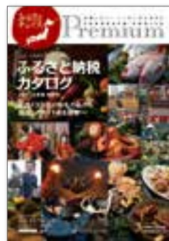
「ふるさと納税」のしくみをわかりやすく紹介し、ママ目線で選んだ「お礼の品」をピックアップ。

フェリシモのお客さまへ向けた市場開放型 B2B 事業として商品を出品していただくサービス。 販売拡大のための広告出稿していただくサービス、またカタログ制作等の支援サービスを地方自治体、法人に提供しています。