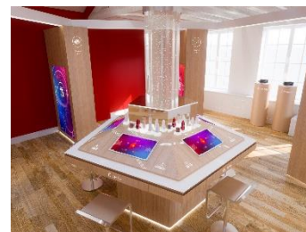
スマートビューティーカウンター