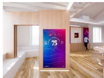
スマートビューティーウォール