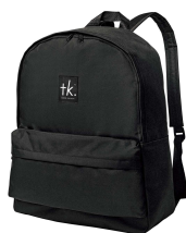
2018年1月号 特別付録 tk.TAKEO KIKUCHI 本気(マジ)で使えるリュックサック