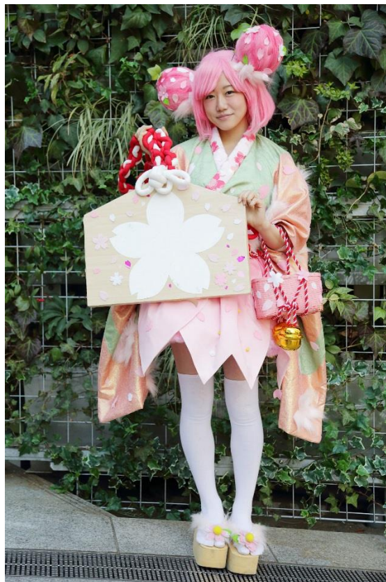
- 学生が「サクラ」をモチーフにデザインした衣装 -