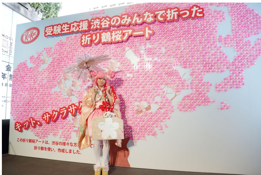
- 学生が「サクラ」をモチーフにデザインした衣装と桜の木をモチーフとしたアートパネル -