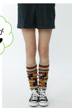
裏起毛イカット柄レッグウォーマー 価格：3足で¥1,000(税抜) カラー：レンガ・エンジ・茶・コゲチャ・紺・黒