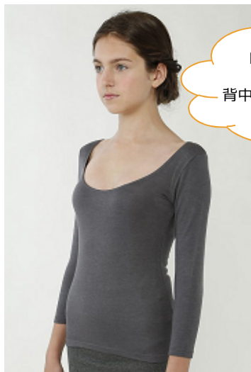
tutuheat plus裏起毛深U8分袖 ¥1,300(税抜) カラー：チャコール・黒・オフ白

昨年よりも発熱・保温・なめらか・ フィット感・保温力がアップ♪ 背中も深いだからアウターからのぞきにくい。