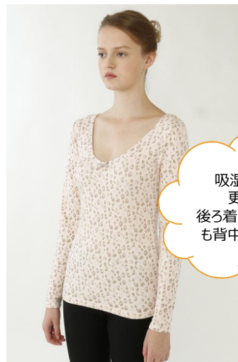
レオパード柄長袖 ¥1,500(税抜) カラー：ピンク・クリーム・スウィートベージュ