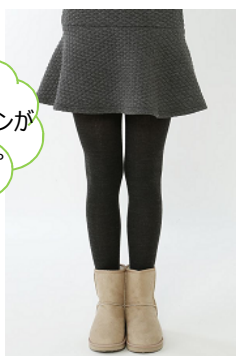
裏起毛リブバルキータイツ 価格：¥1,500(税抜) カラー：チャコール・コゲチャ・黒