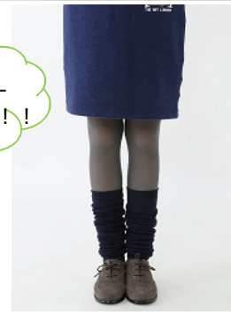
裏起毛パイルドットレッグウォーマー 価格：3足で¥1,000(税抜) カラー：黒・グレー・コゲチャ・サンド・レンガ