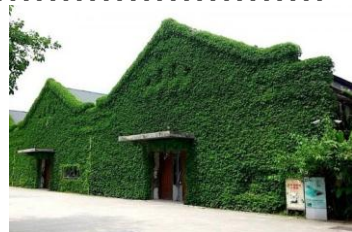
Huashan 1914. Creative Park

名称:roomsLINK TAIPEI (ルームスリンク 台北) 会期:2012年11月8日(木)ー11日(日) *ART TAIPEI 期間 会場:Huashan 1914. Creative Park 展示会:約80ブランド(ファッション、アート、プロダクト)/RUNWAY:約5ブランド 来場数:10000人予定 主催/企画/制作:アッシュ・ペー・フランス株式会社 PR01.事業部×MPX