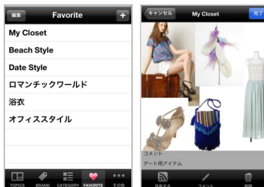
「My Closet 機能」

気になる商品を保存できる「My Closet」機能は、キャンパスに見立てた画面上に、商品画像を自在にレイアウト可能です。自分だけの“お気に入りクローゼット”を楽しく作成し、更にクローゼット画像をSNSでシェアすることも可能。シェアしたクローゼット画像は fashionwalker.com の商品ページにリンクし、購入することができます。